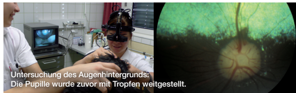
Untersuchung des Augenhintergrunds: Die Pupille wurde zuvor mit Tropfen weitgestellt.

Die Augenuntersuchung von Hund, Katze und Heimtieren erfolgt in den meisten Fällen ohne Sedierung auf einem Untersuchungstisch. Bei Vögeln und Reptilien erfolgt die Untersuchung nach fachgerechter Fixation und ohne Sedierung. Pferde werden für die Erstuntersuchung in aller Regel sediert, um einen genauen Befund zu erstellen. Wildtiere müssen in Narkose gelegt werden.