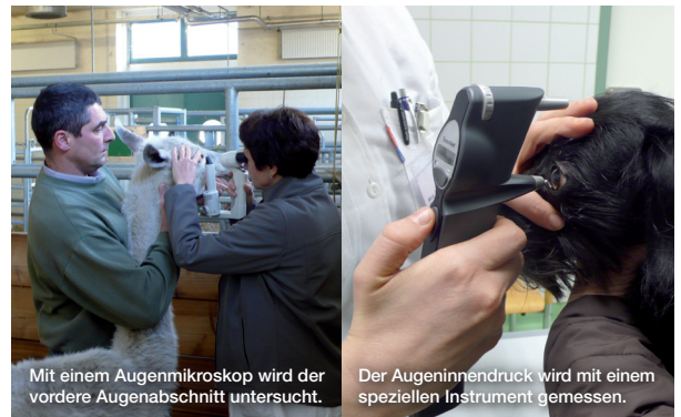
Mit einem Augenmikroskop wird der vordere Augenabschnitt untersucht.